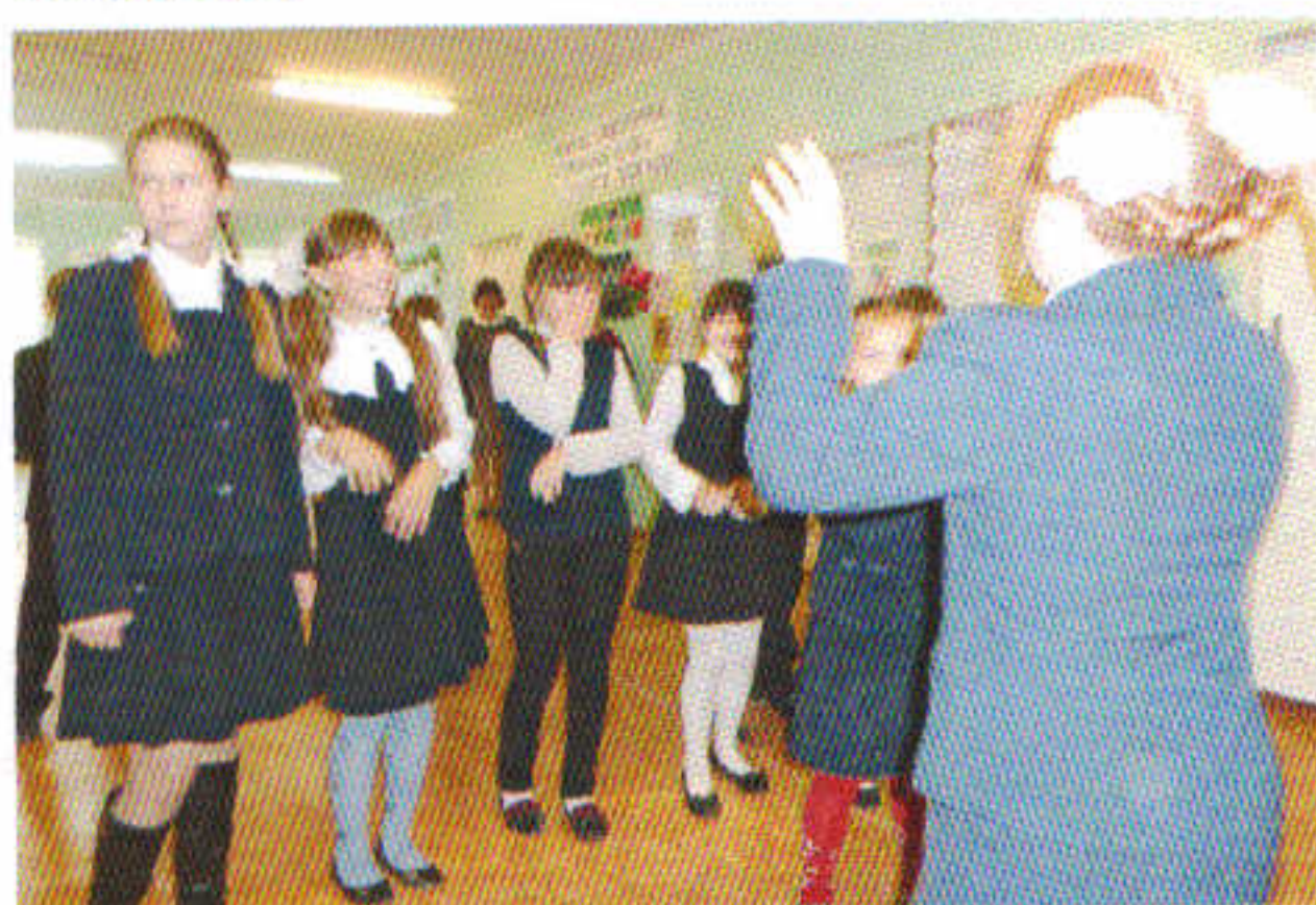
Песня для учителей «Любим и поем».

4 октября в День учителя в школе было празднично. Учителя принимали поздравления от своих учеников. Звучали песни, стихи, ребята подготовили сценки. Все были нарядные. Школа светилась улыбками детей и учителей.