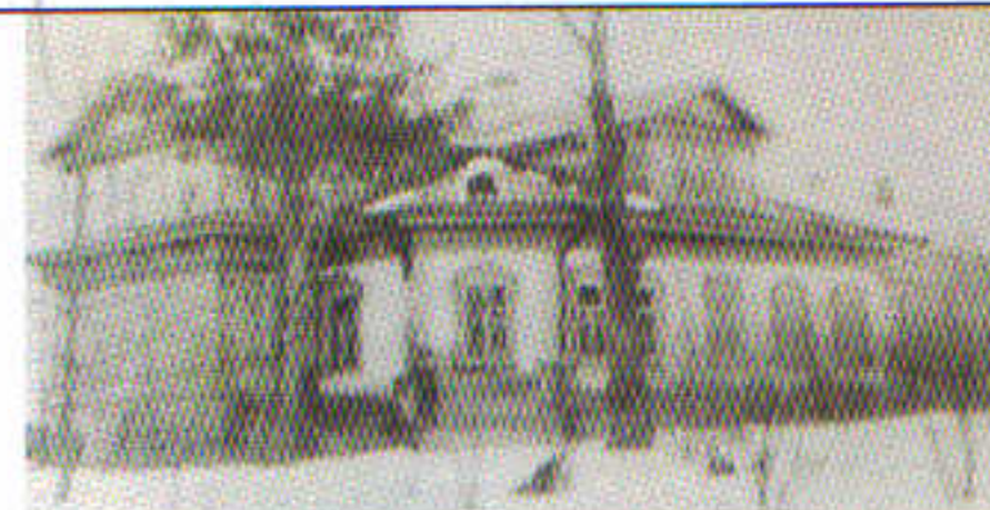
Здание старой школы в корниловской усадьбе