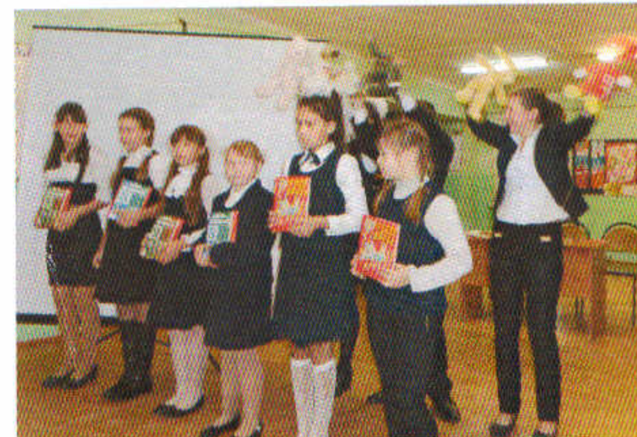
Самодельная песня о школе. Ученики 5-9 классов.