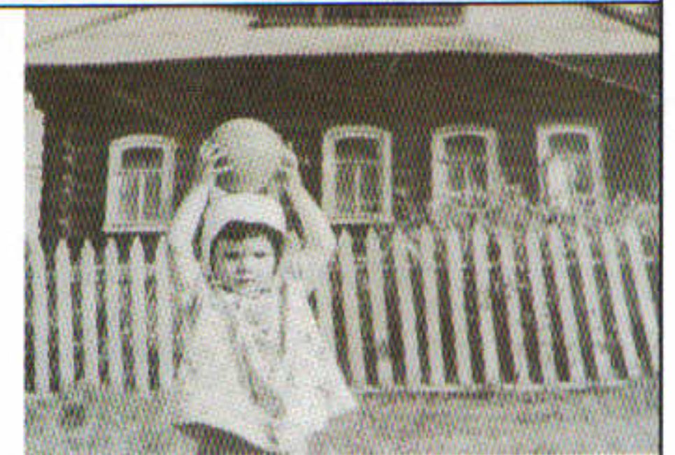
Здание старой школы на хуторе д. Вепрь.

Вепрёвская школа переименована в начальную. В 30-е годы XX столетия начальная школа (1 - 4кл.) размещались в большом доме, расположенном на хуторе д. Вепрь на берегу реки Корожечны.